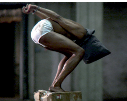
Arrêt sur image d'un clip contre la torture (2007)

Barack Obama a fait volteface en n'accordant qu'à un seul détenu, Mohamed al Qatani, le droit d'être jugé devant une Cour fédérale, les autres devant être jugés uniquement devant les commissions militaires. ■