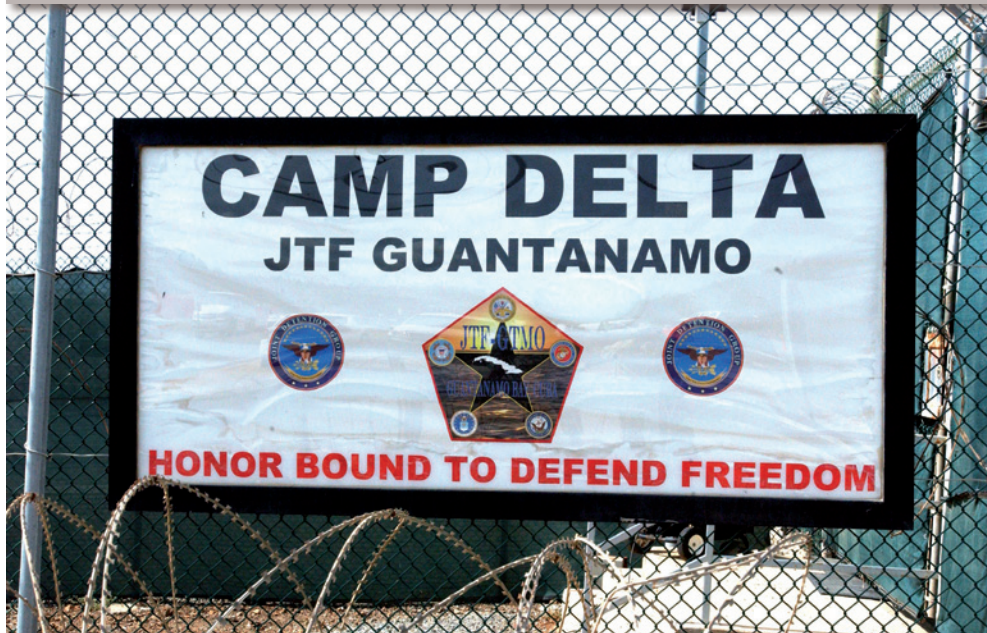
Panneau d'entrée du camp Delta, base navale de Guantánamo, 10 août 2007.

Bien que les identités des interrogateurs varient (Pakistanaï, Marocains, Américains, Syriens et agents spéciaux), il ne fait pas de doute qu'il a été détenu sous le contrôle des États-Unis »