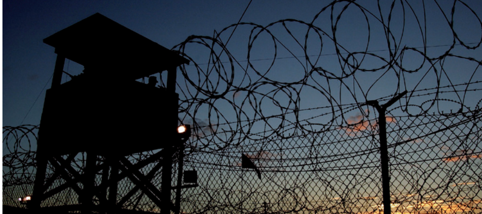
Coucher de soleil sur le camp X Ray le premier jour de sa mise en service, base navale de Guantánamo, 11 janvier 2002.

Au contraire, le gouvernement américain a déclaré que les responsables des abus passés n'auraient pas à rendre des comptes, s'ils avaient suivi les conseils du ministère de la Justice, ce qui renforce l'impunité instaurée par le précédent gouvernement. Le gouvernement a fait pression sur les gouvernements