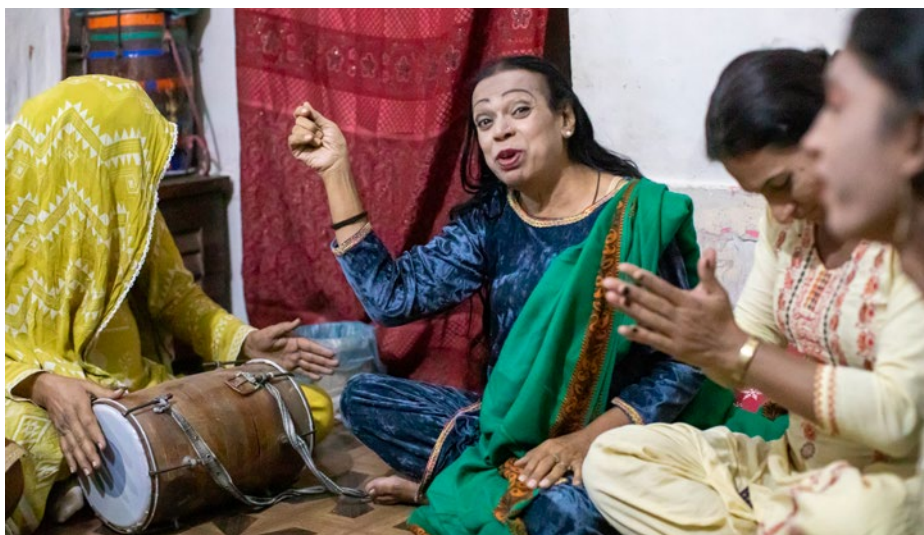
Communauté transgenre de Karachi, Pakistan

« On ne change pas de sexe comme on veut, les personnes qui veulent transitionner vers un autre genre doivent s'accepter comme elles sont. »