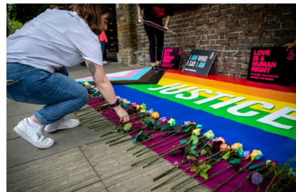
Remise de la pétition tchétchène, Ambassade russe, Londres 2019

Ce que les réseaux sociaux ont changé, ce n'est pas l'existence de ces personnes, mais leur visibilité et la possibilité pour beaucoup d'entre elles de mettre des mots sur leur vécu, de rompre l'isolement, de trouver du soutien et de vivre publiquement à travers les réseaux quand cela n'est pas possible dans les lieux publics. Il s'agit moins d'une nouveauté que d'une meilleure compréhension et d'une plus grande liberté d'en parler.