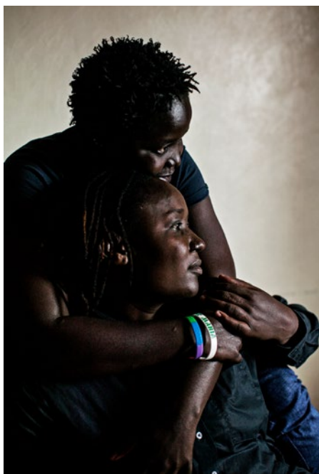
Kenya 2013

« La famille, c'est un papa et une maman. »