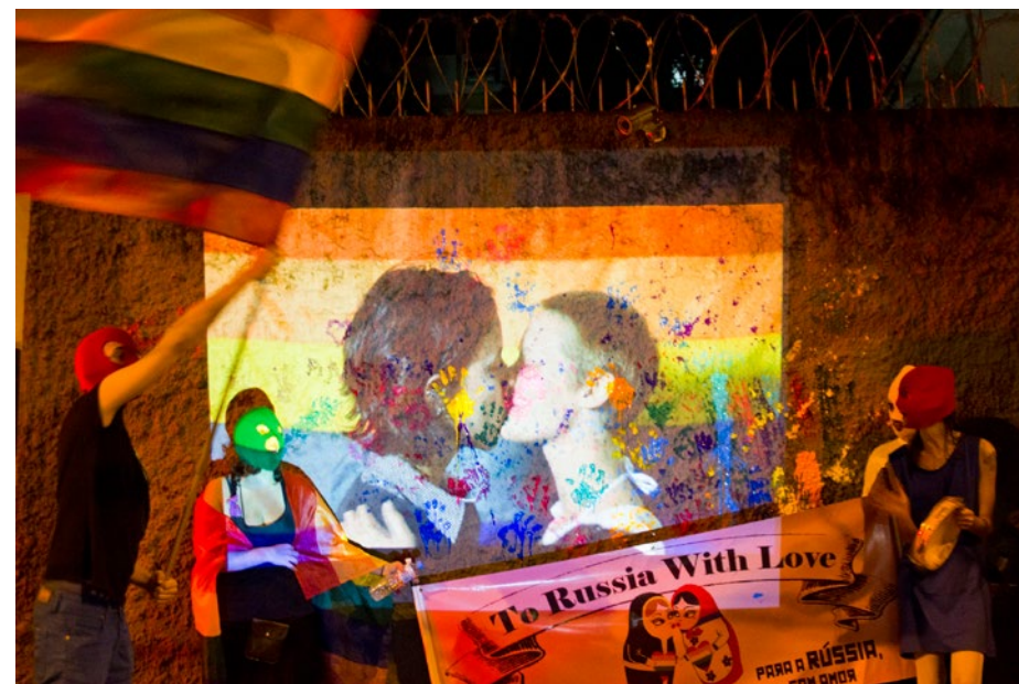
To Russia with love 2013

Selon le rapport de SOS Homophobies 10 , c'est parmi les témoignages de femmes trans que le mal de vivre est le plus prégnant (22 % des cas pour ce groupe). Dans 42 % des cas, il s'explique par les séquelles de violences subies, même très anciennes, ainsi que de la solitude et de l'isolement (30 %), notamment quand la famille est hostile. D'autres encore ont beaucoup de mal à supporter leur corps, en décalage avec les attentes de la société à l'égard de leur genre.