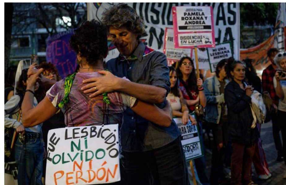
Marche de commémoration du triple meurtre de femmes lesbiennes à Barracas, 2025

Des systèmes efficaces doivent être mis en place pour enregistrer et rapporter les actes de violence motivés par la haine.