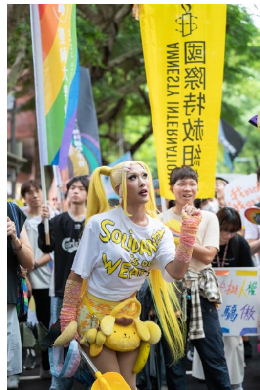
Pride LGBT+ et transgenre, Taiwan, 2025