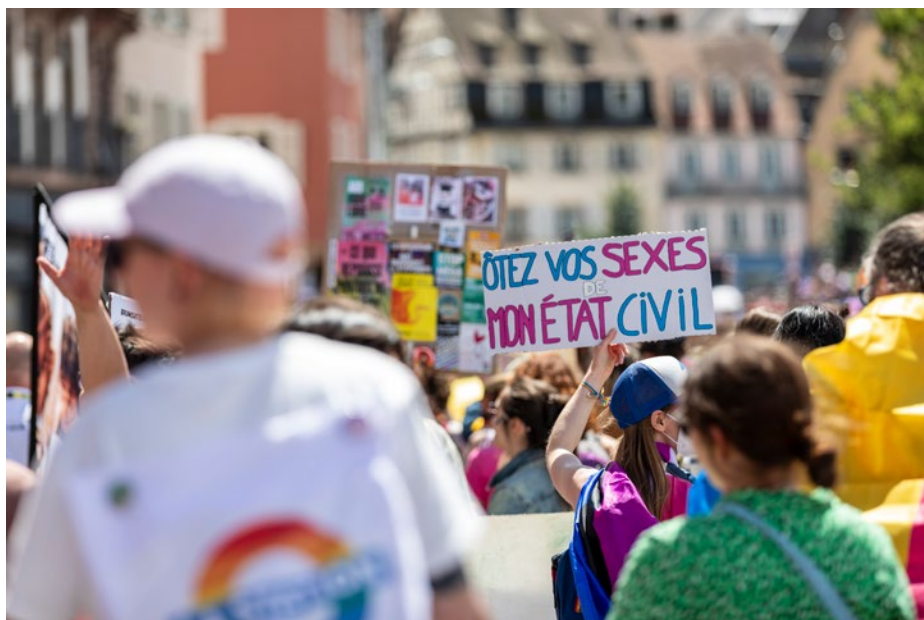
Marche des fiertés à Strasbourg avec le groupe local d'Amnesty International, le 15/06/2024