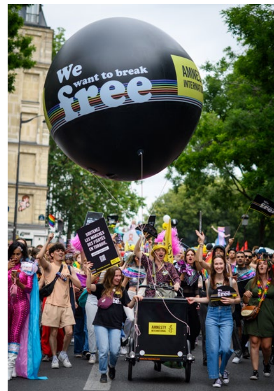
Marche des Fiertés, Paris 2024