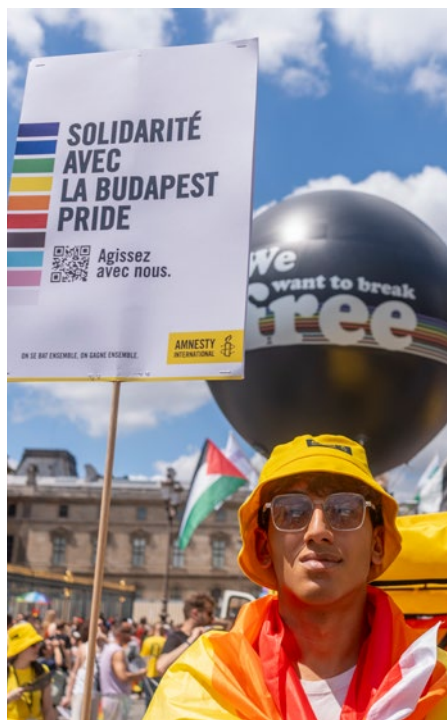
Marche des Fiertés, Paris 2025

Opposer les femmes entre elles détourne l'attention des véritables problématiques : les violences de genre, les discriminations et inégalités de genre qui concernent l'ensemble des femmes et qui sont malheureusement encore trop d'actualité.