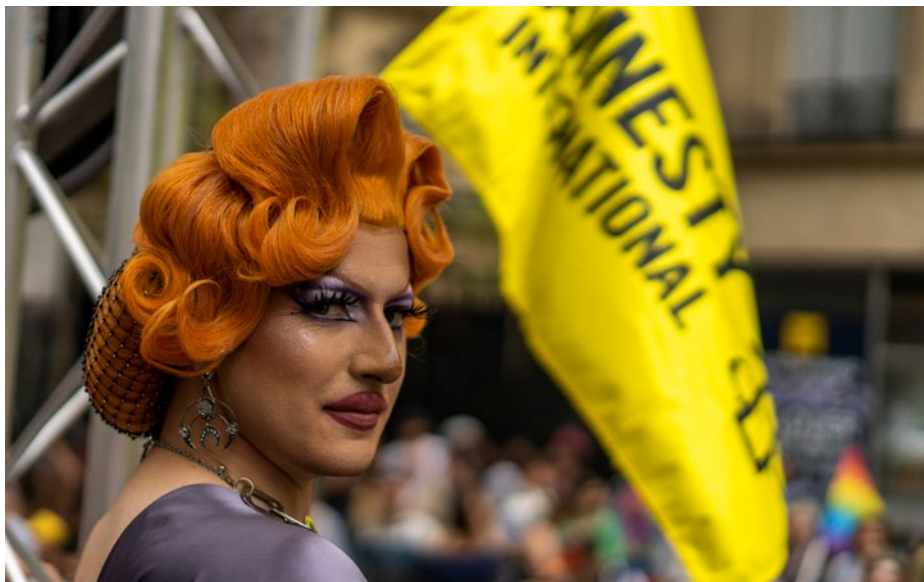
Marche des fiertés, Paris, juin 2022

Portées par des mouvements anti-droits de plus en plus virulents, des législations régressives ciblent les personnes LGBTIQ+, et tout particulièrement les personnes transgenres confrontées à une multiplication des violences, à une stigmatisation accrue et à de nombreuses violations de leurs droits.