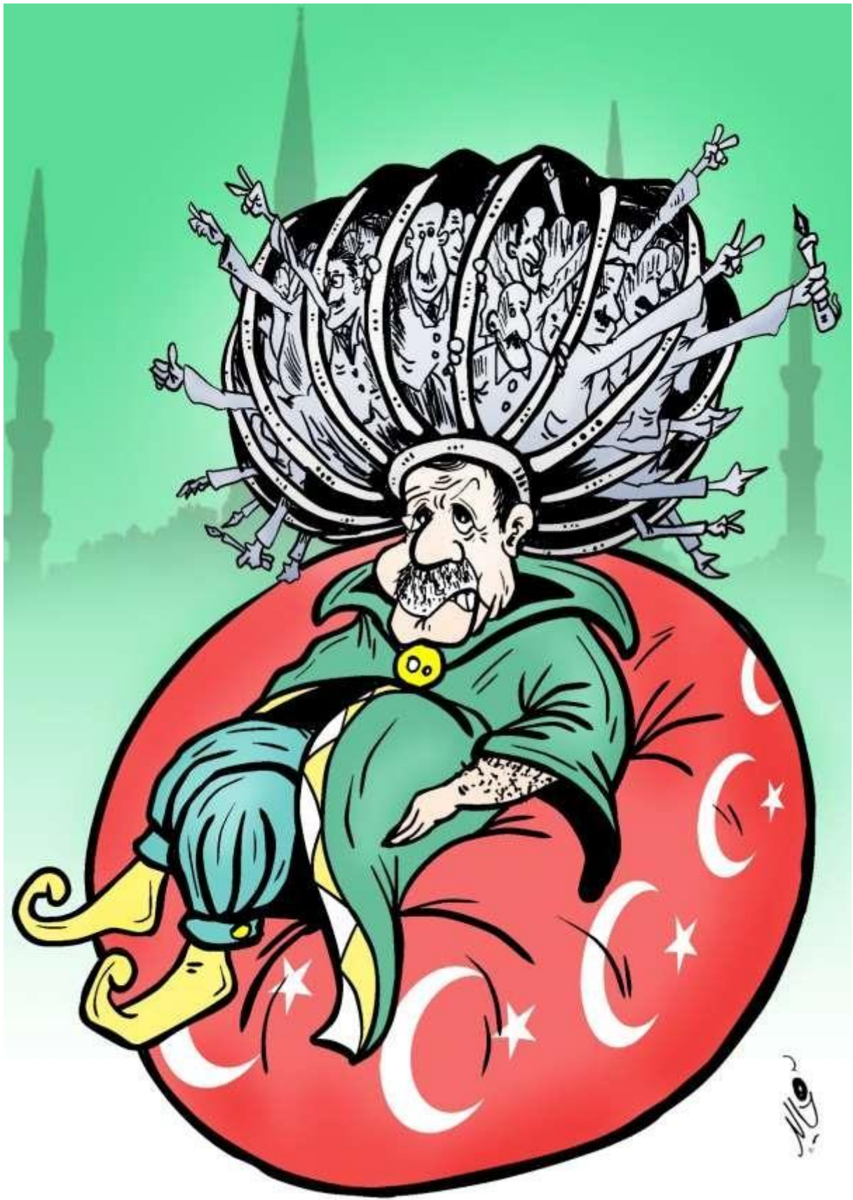
© Khalid Gueddar, Maroc, Cartooning for Peace