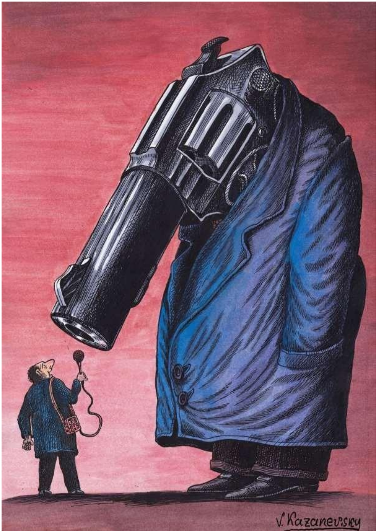
© Vladimir Kazanevsky, Ukraine, Cartooning for Peace