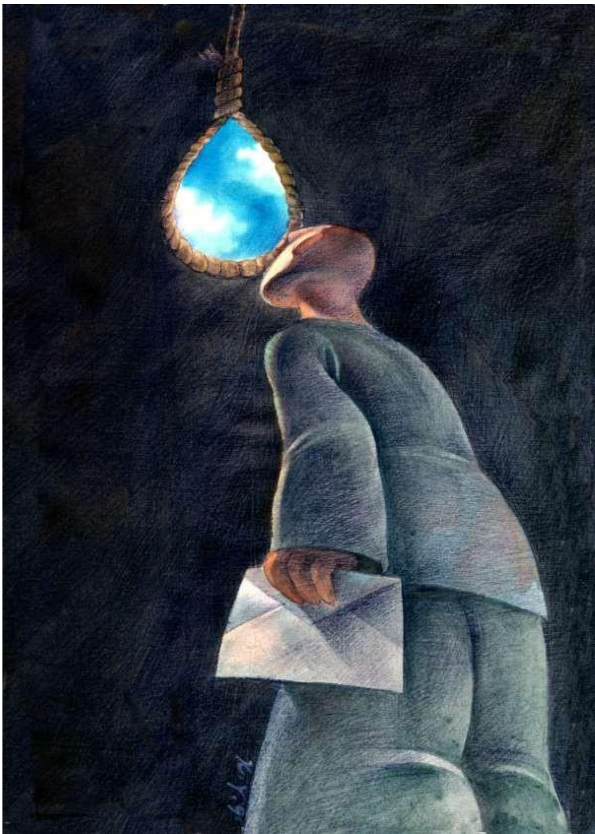
© Xia, Chine, Cartooning for Peace