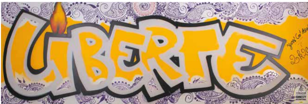
Graf réalisé dans le cadre du projet "Graffer pour Amnesty International" porté par le groupe de Toulouse

Malgré les difficultés rencontrées pour sa mise en place, nous avons pu organiser en avril 2021 une réunion de présentation du rapport annuel 2020, en visioconférence, devant plusieurs donatrices et donateurs. Les porteurs des projets Slamnesty et Dire Non aux discours toxiques ont présenté en direct les actions qu'ils avaient pu mener grâce à ce soutien. Les autres projets financés ont également été exposés. Cela a permis aux membres de la Fondation, ainsi qu'aux deux porteurs de projets présents, de répondre en direct aux questions posées.