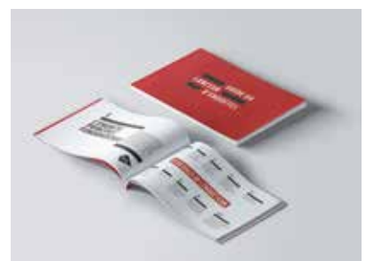
Visuel du Guide du lanceur d'enquête

Durant la première phase, plus de 10 000 personnes ont téléchargé le guide en accès libre sur le site de Disclose, et 3 000 personnes se sont inscrites à la newsletter, qui propose des fiches hebdomadaires sur les outils et méthodes d'accès à l'information.