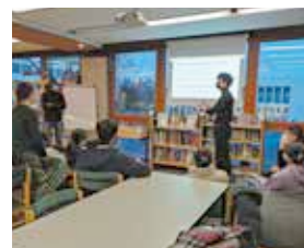
Intervention en classe - © GuitiNews

Ce projet d'éducation aux médias vise à sensibiliser les élèves de collège et de lycée, ainsi que les étudiants aux enjeux de la liberté d'expression et de la fabrique de l'information, via le prisme de la migration.