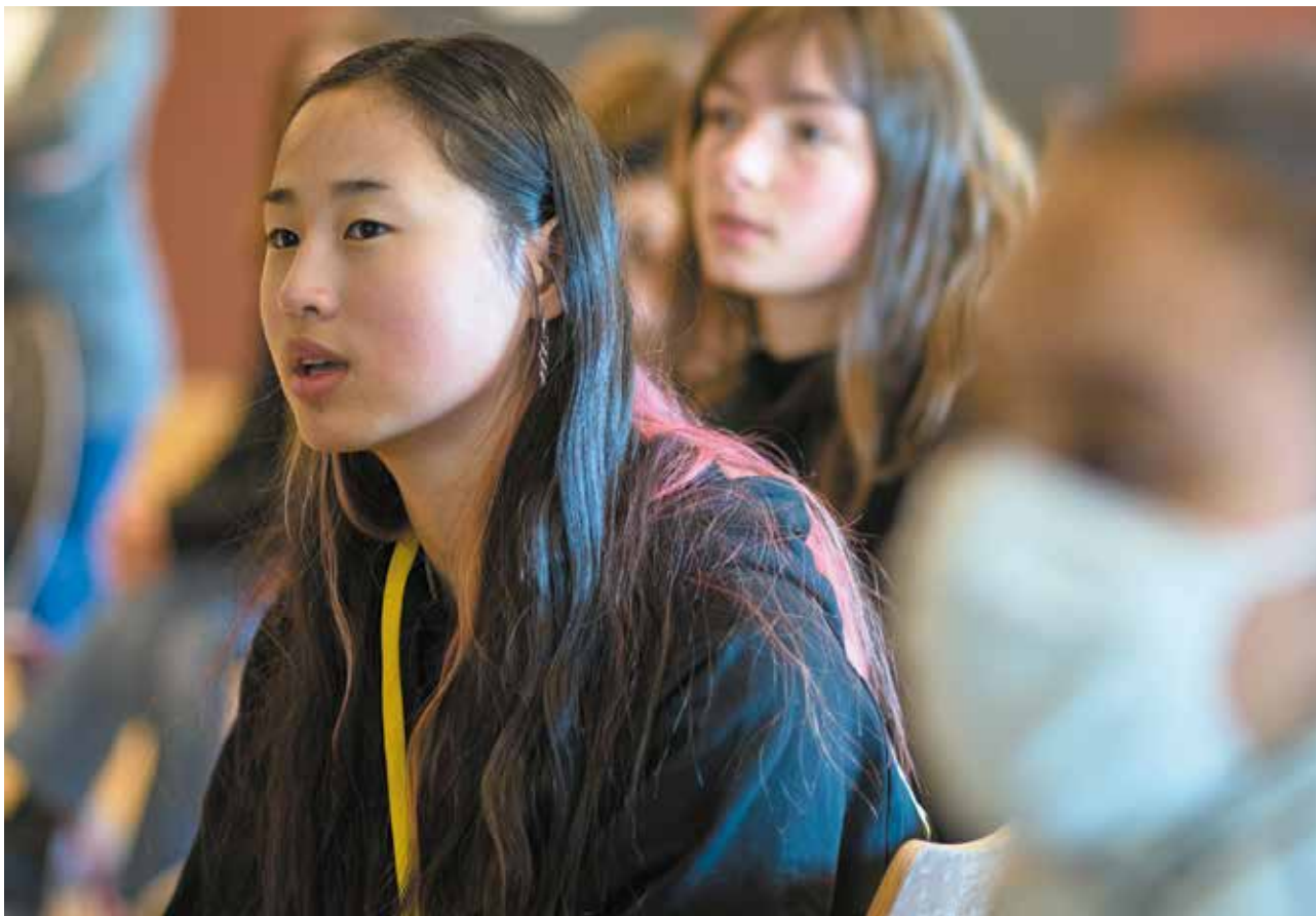
Lors d'une formation

La Fondation Amnesty International France est guidée par les principes de solidarité internationale, d'indépendance, de respect de l'universalité et de l'indivisibilité des droits humains, de responsabilité, de recherche d'efficacité et d'actions en faveur de l'accès à l'information et à la formation pour tous.