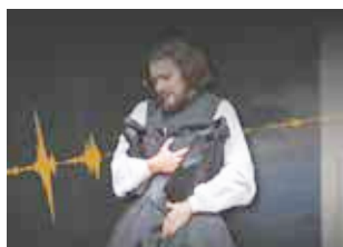
Vignette de la vidéo "la voix a-t-elle un genre" sur le site d'Arte

Il s'agit d'une réalisation, en partenariat avec les productions Arte, de cinq épisodes au sein de l'émission "Gymnastique-La culture sans claquage", alliant pop-culture et interviews d'experts, autour de la thématique « éducation à la santé sexuelle et aux droits humains ». Ces vidéos ont pour but d'offrir une source pertinente et ludique d'informations en santé sexuelle, porteuses des valeurs liées aux droits humains, dans le but de faire évoluer les regards et lutter contre les discours discriminants dans le domaine de la santé sexuelle.