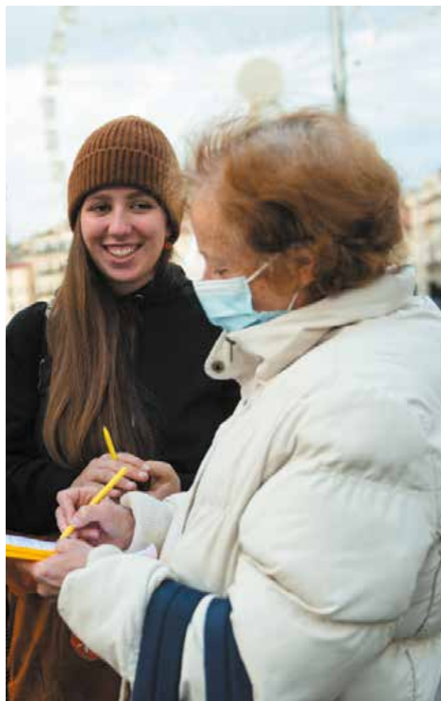
À la rencontre du public