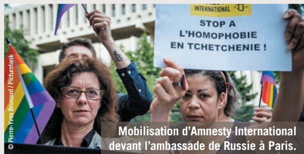
Mobilisation d'Amnesty International devant l'ambassade de Russie à Paris.

Appeler inlassablement à la protection des civils pris au piège des conflits au Myanmar et en Syrie. Défendre les droits des personnes LGBTI en France et en Europe en dénonçant par exemple la répression de ces personnes en Tchétchénie. Défendre les droits des migrants et réfugiés en France et s'opposer à toute coopération qui ne respecte pas les droits humains comme la Libye ou l'Afghanistan.