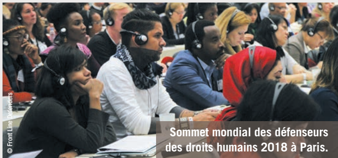
Sommet mondial des défenseurs des droits humains 2018 à Paris.

Tous les jours, des hommes et des femmes sont surveillés, arrêtés, battus ou menacés, simplement pour avoir manifesté pacifiquement, exprimé des idées ou défendu les droits humains. Nous avons ainsi organisé un sommet mondial des défenseurs des droits humains, qui a exigé des États la mise en place d'un plan d'action national pour la protection de celles et ceux qui défendent les droits au quotidien.