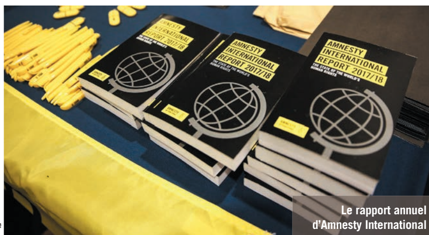
Le rapport annuel d'Amnesty International

Part de la mission sociale en France pour le programme « Protéger les populations et les minorités » : 38,6 %