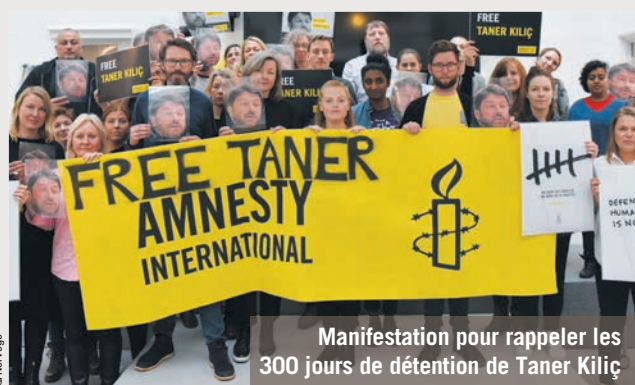
Manifestation pour rappeler les 300 jours de détention de Taner Kiliç

Tous les jours, des hommes et des femmes sont surveillés, arrêtés, battus ou menacés, simplement pour avoir exprimé des idées ou diffusé des informations. Notre lutte pour faire reculer l'injustice et l'impunité permet de renforcer la protection de ces personnes et a notamment pu permettre d'exiger la libération des 10 d'Istanbul, dont la directrice d'Al Turquie Idil Eser, et de Taner Kiliç, son président.