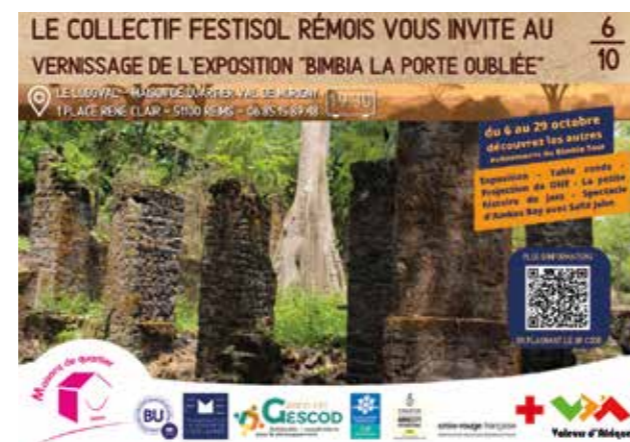
Affiche de l'exposition Bimbia, la porte oubliée

Pour débiter ce projet en automne 2022, le choix a été fait de revenir, lors d'une première phase, sur l'histoire : mieux comprendre ses origines, l'histoire du pays dans lequel on grandit, la façon dont il s'est construit, afin que les jeunes se saisissent mieux du présent, pour pouvoir agir et se projeter dans l'avenir. Cette phase sera suivie en 2023 d'une démarche d'Éducation à la Citoyenneté et à la Solidarité Internationale (ECSI). Enfin, une visite du Camp des Milles leur fera vivre des expériences psychosociales pour les aider à devenir des citoyens éclairés et responsables, faisant preuve d'esprit critique.