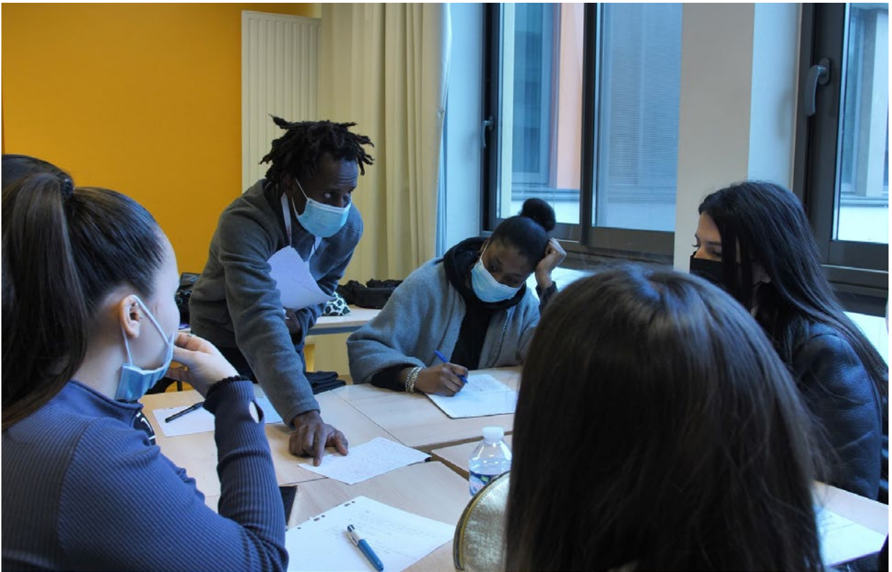
Atelier des élèves dans le cadre du projet Cultivons les droits humains