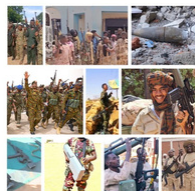
NEW WEAPONS FUELLING THE SUDAN CONFLICT EXPANDING EXISTING ARMS EMBARGO ACROSS SUDAN TO PROTECT CIVILIANS AMNESTY

Le conflit au Soudan est alimenté par un afflux constant d'armes dans le pays. C'est ce que dénonce Amnesty International dans un rapport publié le 25 juillet . Intitulé "New Weapons Fuelling the Sudan Conflict", il montre comment des armes et des munitions récemment fabriquées ou transférées provenant de pays tels que la Chine, les Émirats arabes unis, la Russie, la Serbie, la Turquie et le Yémen ont été importés au Soudan, puis, dans certains cas, détournées vers le Darfour. Nos recherches montrent que ces armes ont été mises entre les mains de combattants accusés de violations du droit international humanitaire et des droits humains. Nous appelons le Conseil de sécurité de l'ONU à étendre l'embargo sur les armes au reste du Soudan et renforcer ses mécanismes de surveillance et de vérification.