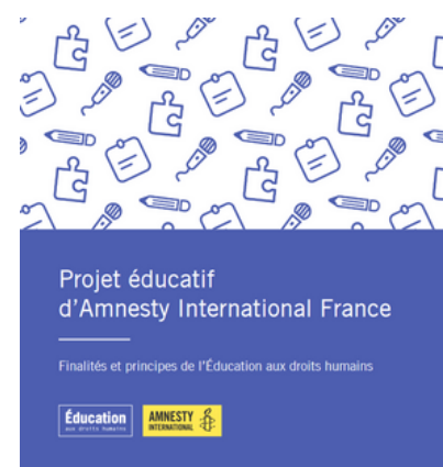
Projet Educatif d'AIF ©AIF

Ensemble, faisons de cette année un moment fort pour l'Éducation aux droits humains. Nous vous souhaitons une excellente rentrée associative et de belles réussites dans vos interventions en EDH !