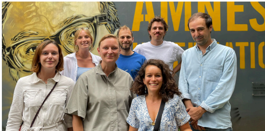
Equipe mobilisation