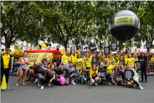
Marche des fiertés, le 22/06/24 à Paris

La saison des Marches des Fiertés touche à sa fin avec les dernières marches prévues en septembre. Au total, c'est plus de 30 cortèges qui ont accueilli la présence d'Amnesty International France et de ses militant.es. Nous avons défilé en solidarité avec les personnes LGBTI+ en Turquie, qui connaissent un climat de plus en plus hostile et répressif, en arborant les couleurs de notre campagne « We want to break free – nous voulons nous libérer ». La pétition « Défendons ensemble les marches des fiertés en Turquie » a récolté 22443 signatures à date. Bravo à toutes et tous pour votre implication !