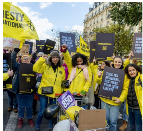
Cortège d'Amnesty International France lors de la marche contre les violences sexistes et sexuelles à Paris, 25/11/23

Le 8 mars, à l'occasion de la journée internationale des droits des femmes, nous revendiquons les droits des femmes afghanes dans la rue et nous demandons à la France d'accueillir celles qui cherchent protection. Retrouvez la pétition, les visuels de pancartes, les dépliants « mégaphones » à distribuer et les marches organisées près de chez vous sur l'Espace militant .