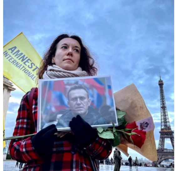
Amnesty International France au rassemblement en hommage à Alexeï Navalny, Paris le 22/02/24.