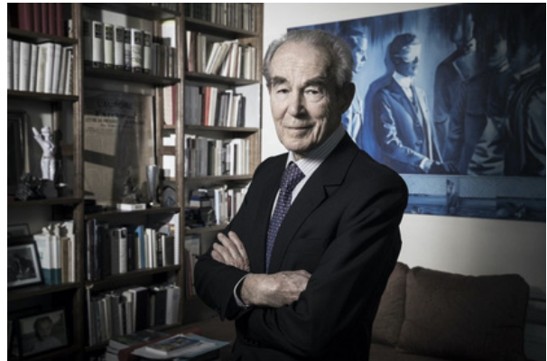
Robert Badinter

Il est des femmes et des hommes qui marquent leur époque. Il en est d'autres qui la transforment. Robert Badinter appartiendra à jamais à ces deux catégories. Son héritage est immense : abolition de la peine de mort, fin des juridictions d'exception, dépénalisation de l'homosexualité, renforcement du droit des victimes d'infraction, amélioration des conditions de vie en prison avec pour objectif la réinsertion, mise en place de la peine de travail d'intérêt général... Un homme qui aura dédié sa vie aux droits humains et à la dignité de la personne humaine.