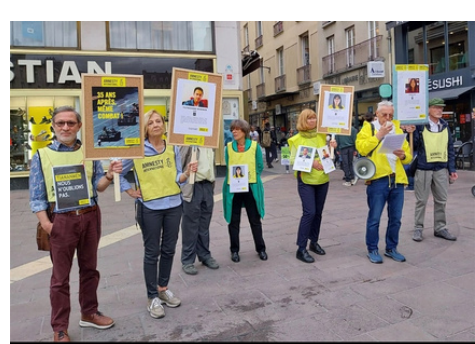
Rassemblements à Toulouse, Grenoble et Paris