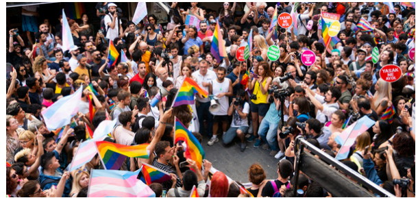
Pride d'Istanbul 2019

La saison des Marches des Fiertés a démarré ce vendredi 17 mai, journée internationale de lutte contre l'homophobie et la transphobie, avec de nombreuses marches programmées sur tout le territoire !