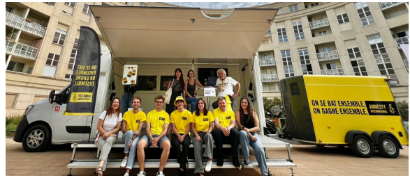
Mobilisation de la structure locale et de l'antenne jeune de Montpellier lors du passage de la flamme le 13 mai

Pétition, mobilisation autour du passage de la flamme, plaidoyer local : retrouvez toutes les informations, le guide militant et les ressources à disposition sur la page « Militant-es » désormais en ligne.