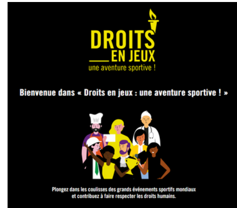
"Droits en Jeux : une aventure sportive !".

Il est disponible en deux versions : une physique et une en ligne sur https://droits-en-jeux.fr/ . La version en ligne, plus légère, offre une expérience autonome, idéale pour toucher un large public en solo ou en groupe. La version physique est réservée aux structures qui mènent des interventions d'Éducation aux droits humains, dans limite d'un jeu par structure. Êtes-vous prêts et prêts à utiliser ce jeu pour vos interventions ?