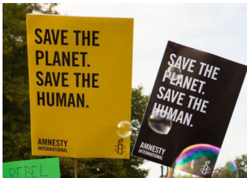
Save the planet. Save the human

L'Espace Éducation s'enrichit de nouvelles ressources pédagogiques sur le lien crucial entre le climat et les droits humains.