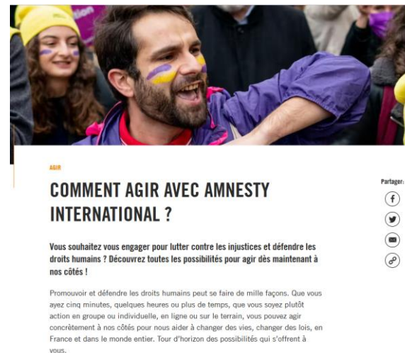
Page comment agir avec AIF