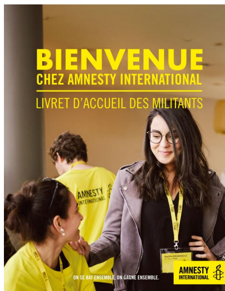
Livret accueil des militants