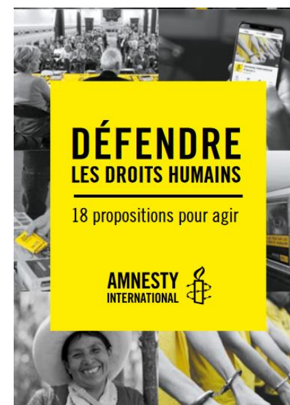
18 propositions pour agir