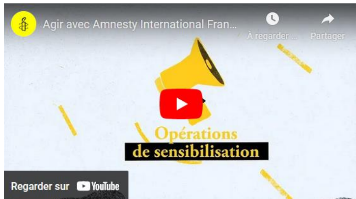
Vidéo « Agir avec AIF »