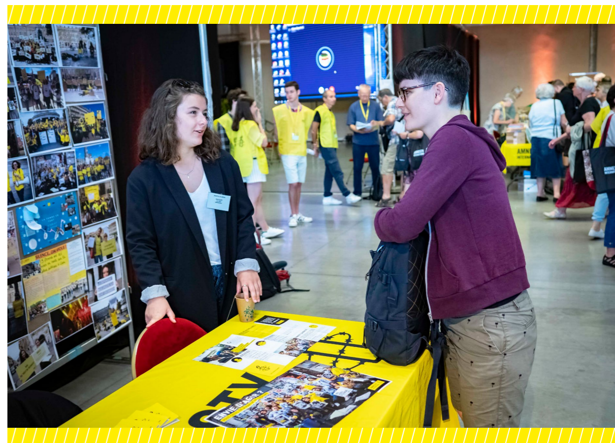
AG 2019, Arles