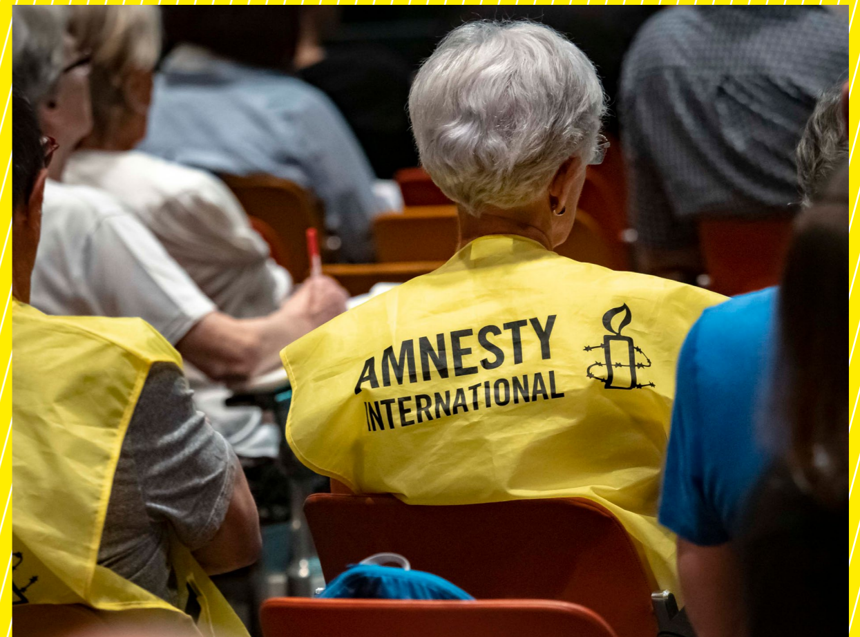
AG 2019, Arles