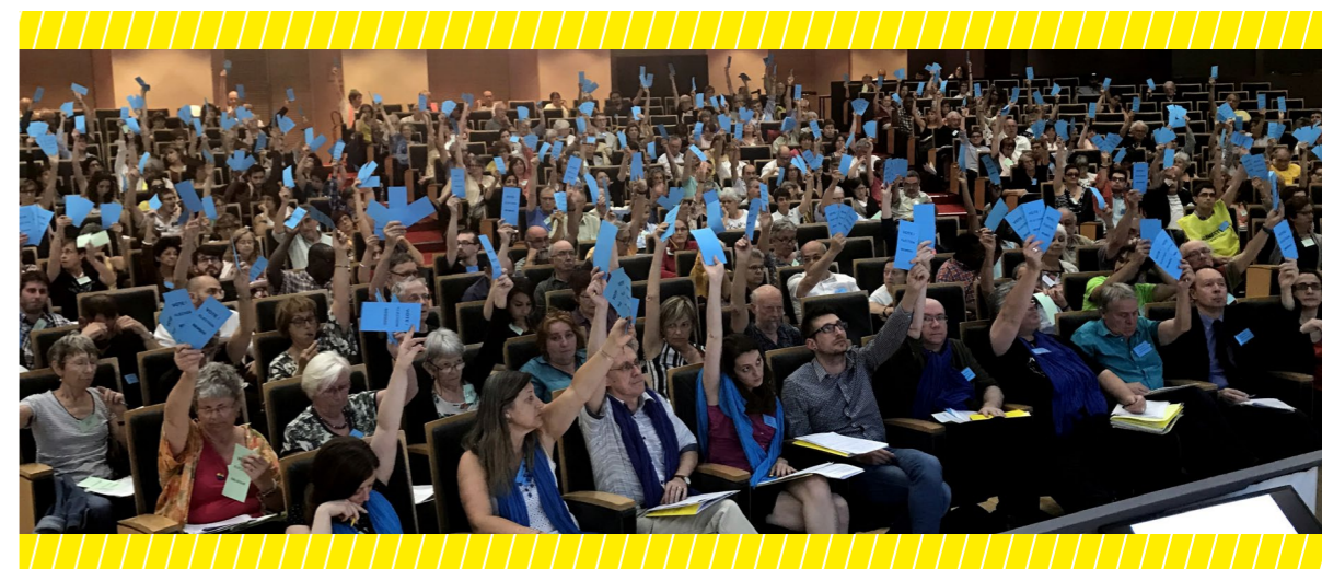
AG 2017, Paris

En cas d'absence de l'auteur ou de l'autrice de la résolution, l'amendement est soumis au vote selon la procédure habituelle.