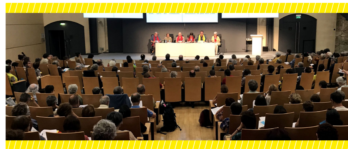
AG 2017, Paris

Sauf dispositions particulières, les décisions sont adoptées à la majorité absolue des voix exprimées.