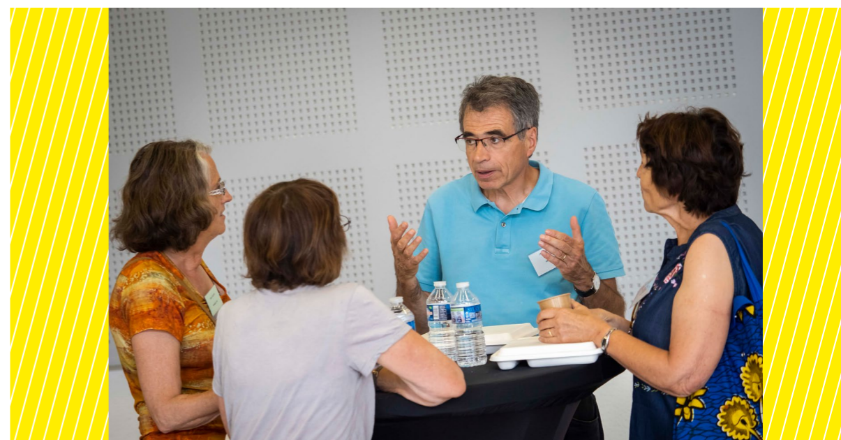
AG 2019, Arles