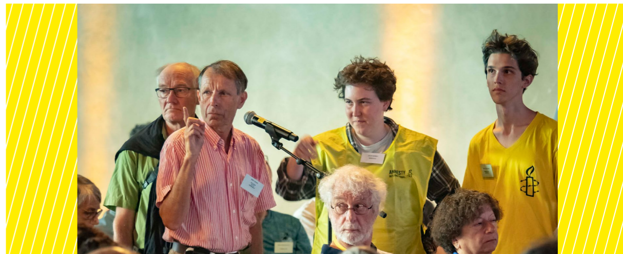
Prise de parole, AG 2019, Arles