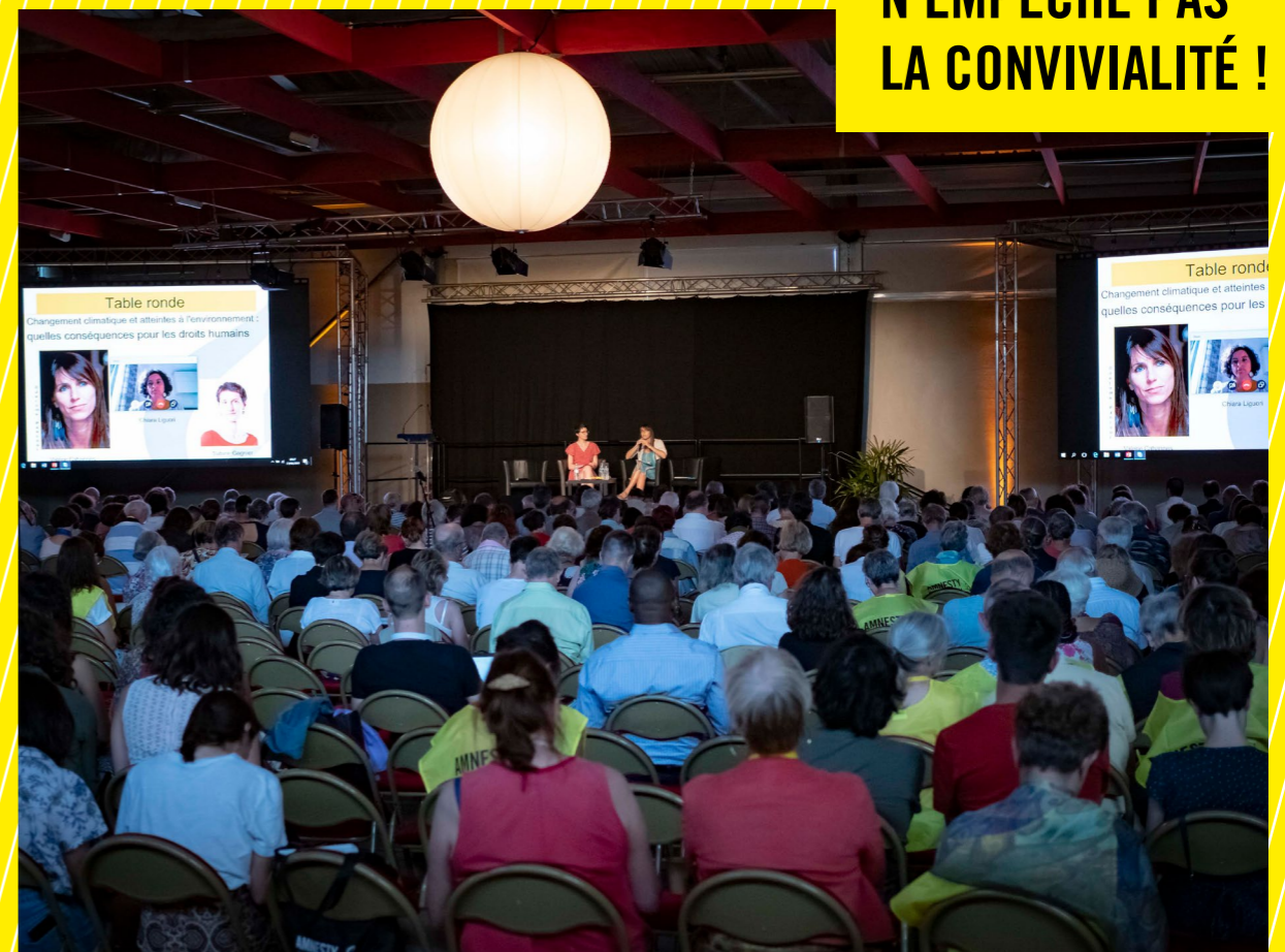
AG 2019, Arles

LA RÉFLEXION N'EMPÊCHE PAS LA CONVIVIALITÉ !