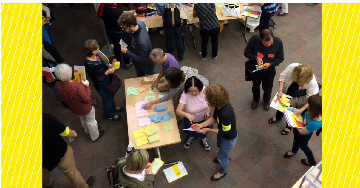
AG 2016, Strasbourg