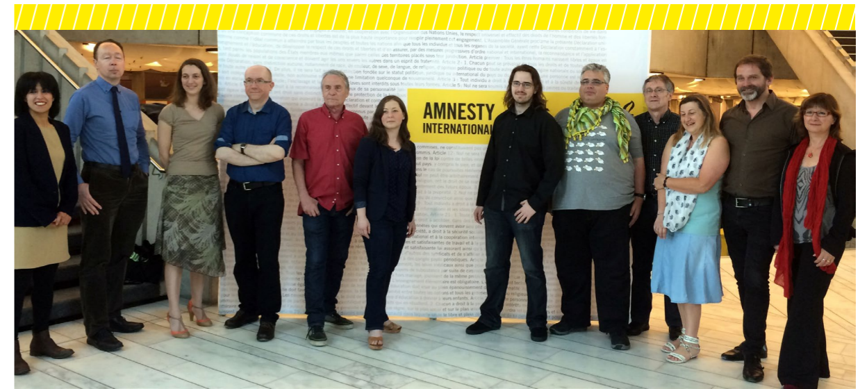
L'Assemblée générale élit le Conseil d'Administration

Quelle peut être ma réponse ? (réponse en annexe 3)