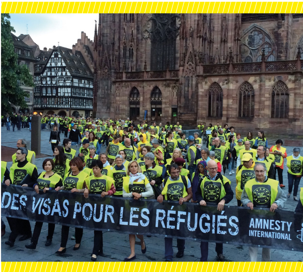
L'Assemblée générale d'AIF est presque toujours l'occasion d'un événement militant (ici à Strasbourg en 2016)