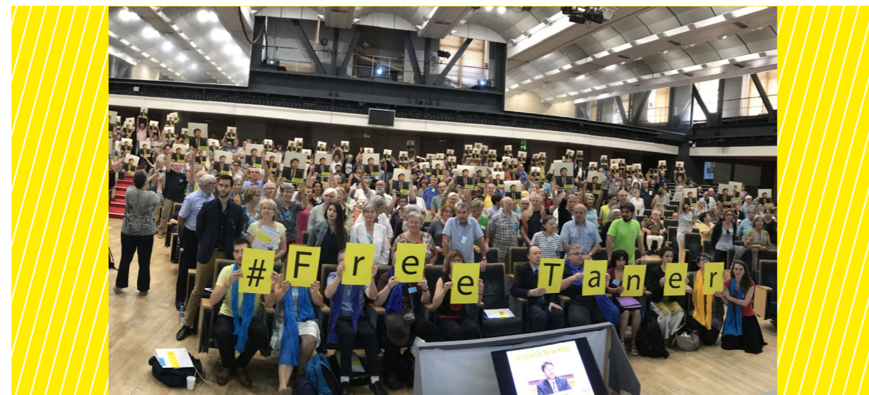
AG 2017, Paris