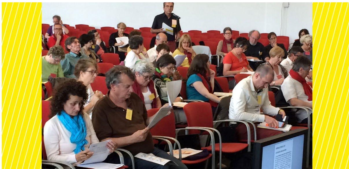
AG 2016, Strasbourg