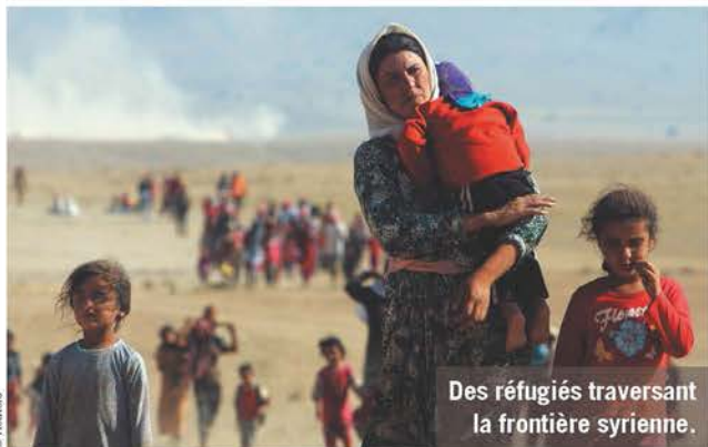
Des réfugiés traversant la frontière syrienne.

Les populations civiles sont les premières victimes des conflits alors que le droit international exige qu'elles en soient protégées. Nous poursuivons notre combat auprès des autorités pour leur rappeler que le respect du droit et la protection des civils sur place ou des réfugiés contraints de fuir sont des obligations absolues.