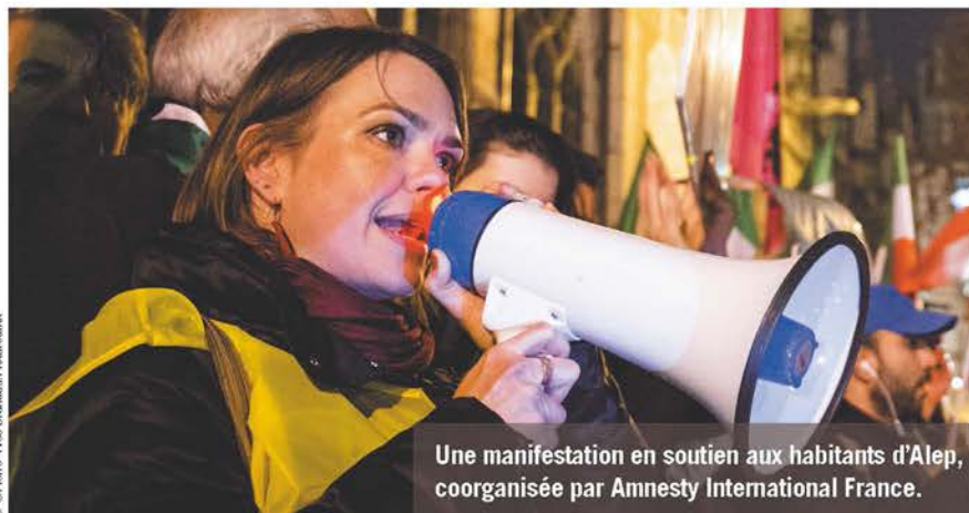
Une manifestation en soutien aux habitants d'Alep, coorganisée par Amnesty International France.

Part de la mission sociale en France : 31,4 %