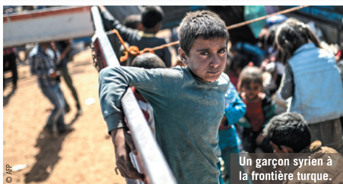
Un garçon syrien à la frontière turque.