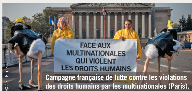
Campagne française de lutte contre les violations des droits humains par les multinationales (Paris).

La lutte contre toutes les formes de violation des droits humains est au cœur des préoccupations d'Amnesty International. Trente ans après la catastrophe de Bhopal en Inde et trois ans après l'effondrement du Rana Plaza au Bangladesh, nous combattons, dans le cadre de la campagne « Faites pas l'autruche », pour que les responsabilités des acteurs économiques soient établies et que les victimes obtiennent justice et réparation.