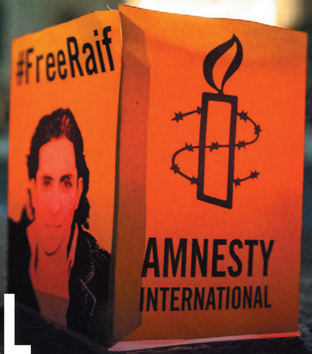
Manifestation pour la libération de Raïf Badawi (Autriche, juin 2015)