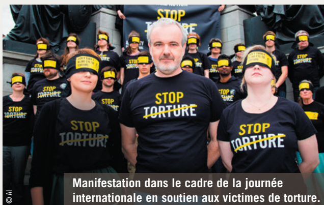
Manifestation dans le cadre de la journée internationale en soutien aux victimes de torture.

La lutte contre la torture, l'impunité, la peine de mort et les transferts d'armes font partie des combats prioritaires d'Amnesty International. Lancée en 2014, « Stop torture » est sa troisième campagne mondiale pour lutter contre la torture. Elle visait à obtenir des engagements précis de la part des pays qui pratiquent ou tolèrent encore le recours à la torture car, bien qu'interdite, cette pratique reste courante dans de nombreux États.