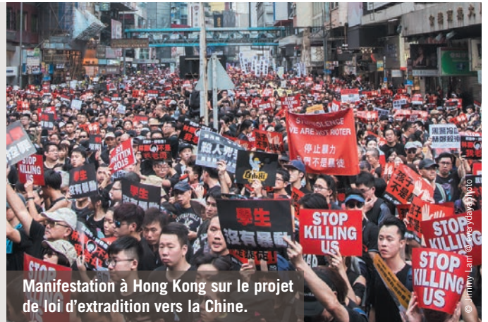
Manifestation à Hong Kong sur le projet de loi d'extradition vers la Chine.

Part de la mission sociale en France pour ce programme : 24 %