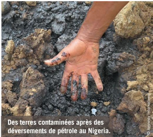
Des terres contaminées après des déversements de pétrole au Nigeria.