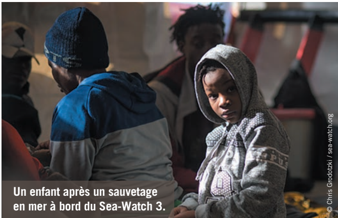
Un enfant après un sauvetage en mer à bord du Sea-Watch 3.