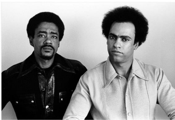
Huey P. Newton et Bobby Seale, les fondateurs

Autour de 1966, l'émergence du mouvement Black Power , globalement actif de 1966 à 1975, radicalise la lutte pour les droits civiques, et conduit à l'élaboration d'une lutte pour la dignité raciale, l'autonomie politique et économique, et l'émancipation de la tutelle des Blancs. Le concept de Black power tend à désigner un ensemble de groupes disparates dans leur nature, objectifs et leurs moyens d'action. On compte dans cette mouvance : Black muslims (que Malcom X rejoindra), le Congress of Racial equality , le Student non violent Coordinating Committee (SNCC) et les Black Panthers . Tous se rejoignent plus ou moins autour du besoin d'une organisation non-mixte, qui n'occulte en rien la nécessité d'unir tous les groupes du prolétariat, quelle que soit leur couleur, dans le cadre d'une lutte des classes. A la base, le mouvement était loin de prôner un suprématisme noir, ni même un séparatisme radical tel qu'il a pu être prôné plus tard par la Nation of Islam . Ce concept d'organisation non-mixte influença notamment le mouvement féministe.