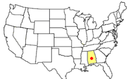
Figure 1: Montgomery - Alabama

Martin Luther King est né à Atlanta en 1928. Il est originaire d'une famille de pasteurs. En 1954, à l'âge de 26 ans, il devient pasteur baptiste et exerce à Montgomery, dans l'Alabama. Il se marie en 1953 avec Coretta Scott , avec qui il aura 4 enfants.