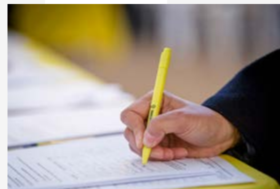
Paris, édition 2017

Pour les actions de solidarité, il est tout à fait envisageable de continuer jusqu'à ce que la situation soit résolue.