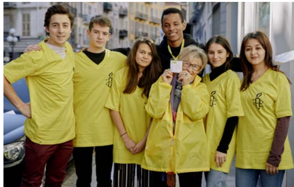
Nice, lors de l'édition 2017

Valoriser vos actions c'est d'abord les faire connaître en amont au plus grand nombre notamment en utilisant le formulaire de notre site pour annoncer votre événement :