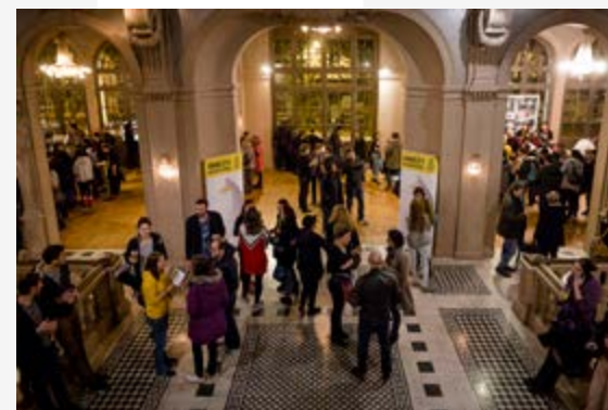
Paris, au Trianon, édition 2017