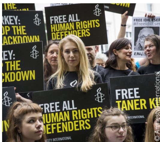
Manifestation devant l'ambassade de Turquie à Londres (Royaume-Uni), 12 juillet 2017.

Le travail d'Amnesty International vise à protéger les personnes et à leur permettre d'avoir prise sur leur propre vie : de l'abolition de la peine de mort à la promotion des droits sexuels et reproductifs ; de la lutte contre la discrimination à la défense des droits des réfugiés et des migrants . Nous contribuons à faire traduire en justice les tortionnaires, à changer les législations répressives et à faire libérer les personnes emprisonnées uniquement pour avoir exprimé leurs opinions. Nous défendons sans exception celles et ceux dont la liberté ou la dignité est menacée.