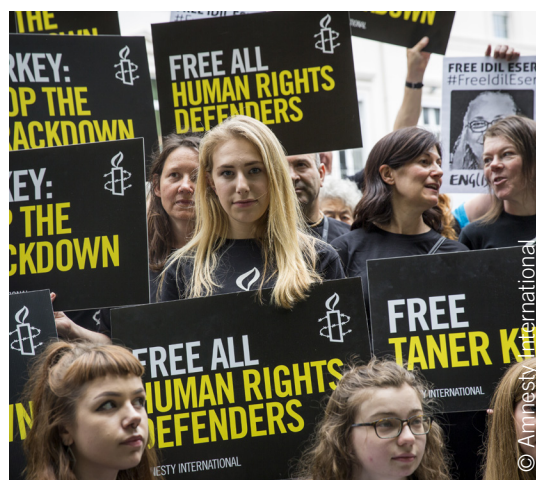
Manifestation devant l'ambassade de Turquie à Londres (Royaume-Uni), 12 juillet 2017.

Le travail d'Amnesty International vise à protéger les personnes et à leur permettre d'avoir prise sur leur propre vie : de l'abolition de la peine de mort à la promotion des droits sexuels et reproductifs ; de la lutte contre la discrimination à la défense des droits des réfugiés et des migrants . Nous contribuons à faire traduire en justice les tortionnaires, à changer les législations répressives et à faire libérer les personnes emprisonnées uniquement pour avoir exprimé leurs opinions. Nous défendons sans exception celles et ceux dont la liberté ou la dignité est menacée.