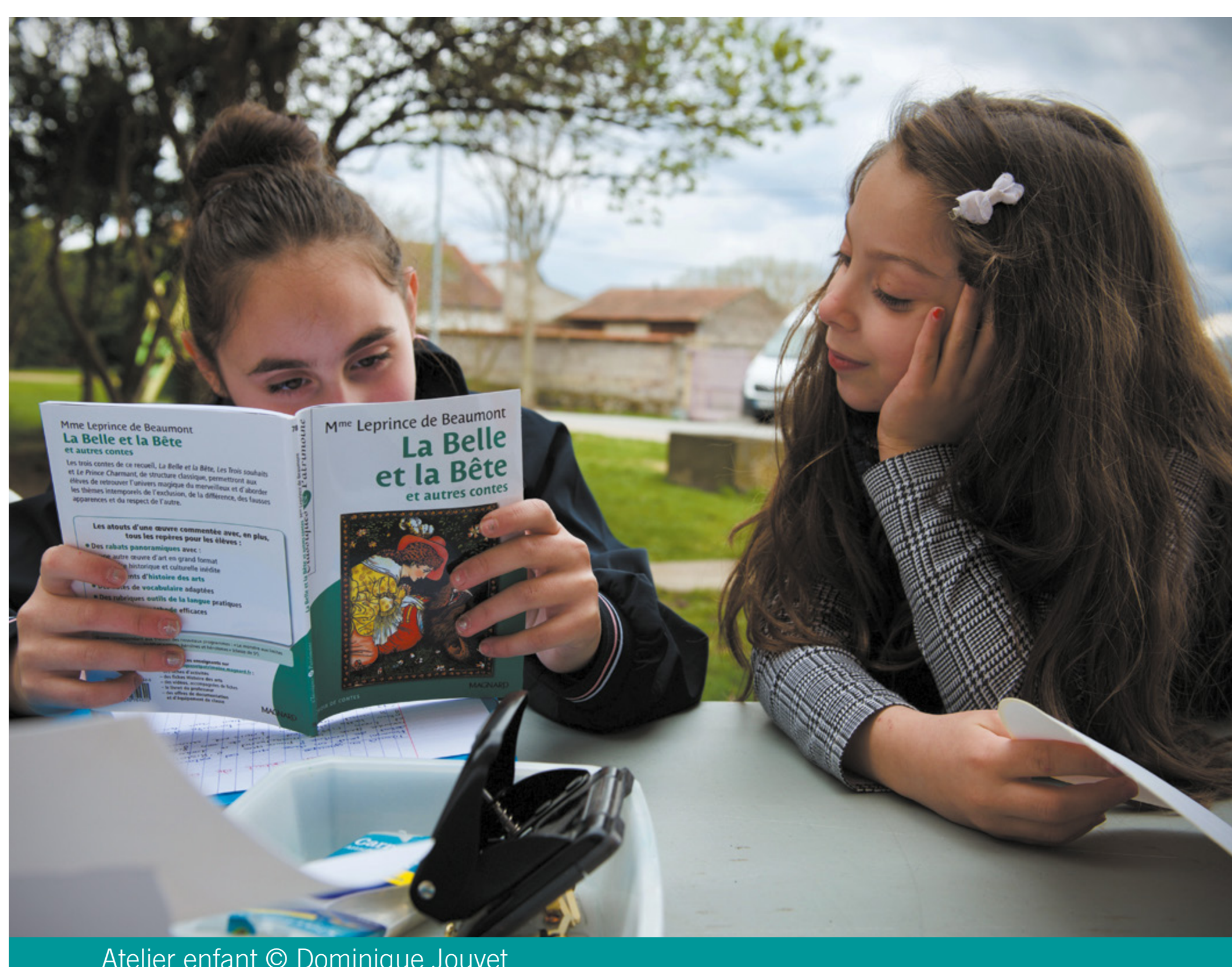
Atelier enfant