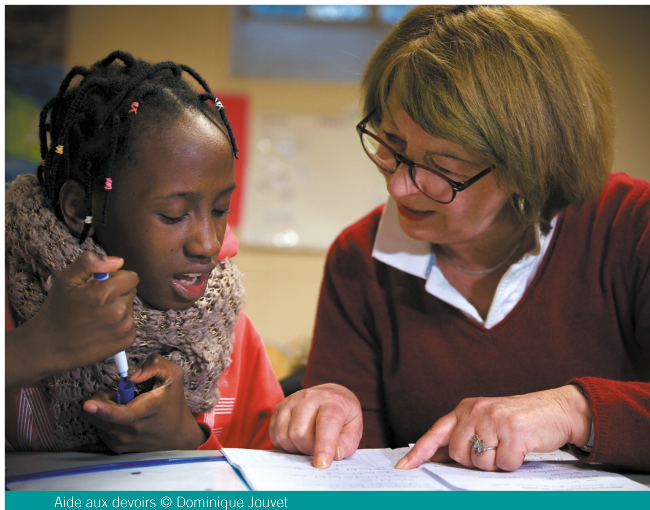
Aide aux devoirs