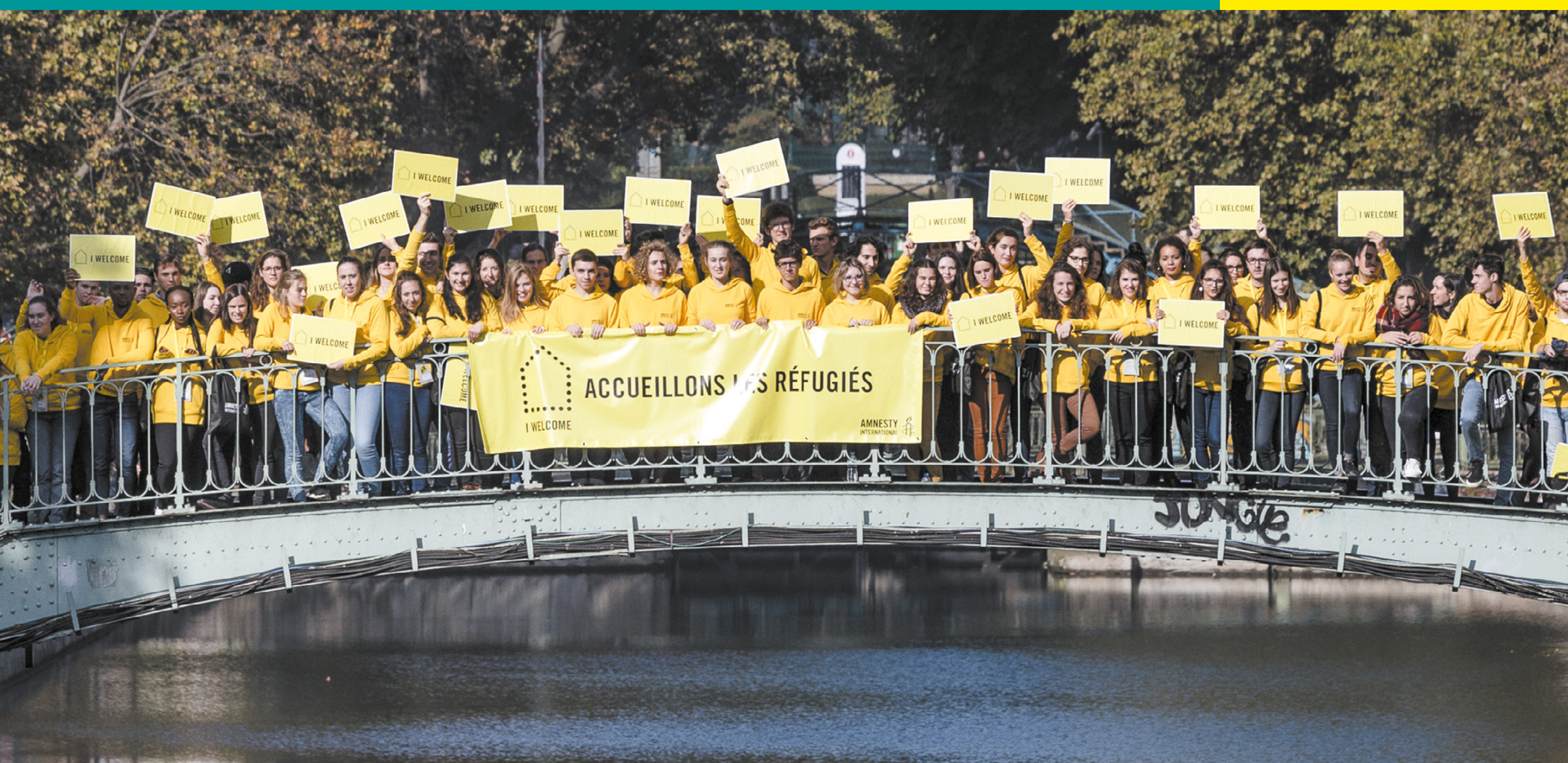
Week-end Antenne Jeunes à Paris

Les responsables politiques répètent souvent que la France n'a pas les moyens d'accueillir des réfugiés. Dans un premier temps, l'accueil des réfugiés représente un coût. Il est essentiel car il leur permet de vivre dignement le temps de l'examen de leur demande d'asile. Mais ces hommes et ces femmes ont également beaucoup à apporter.