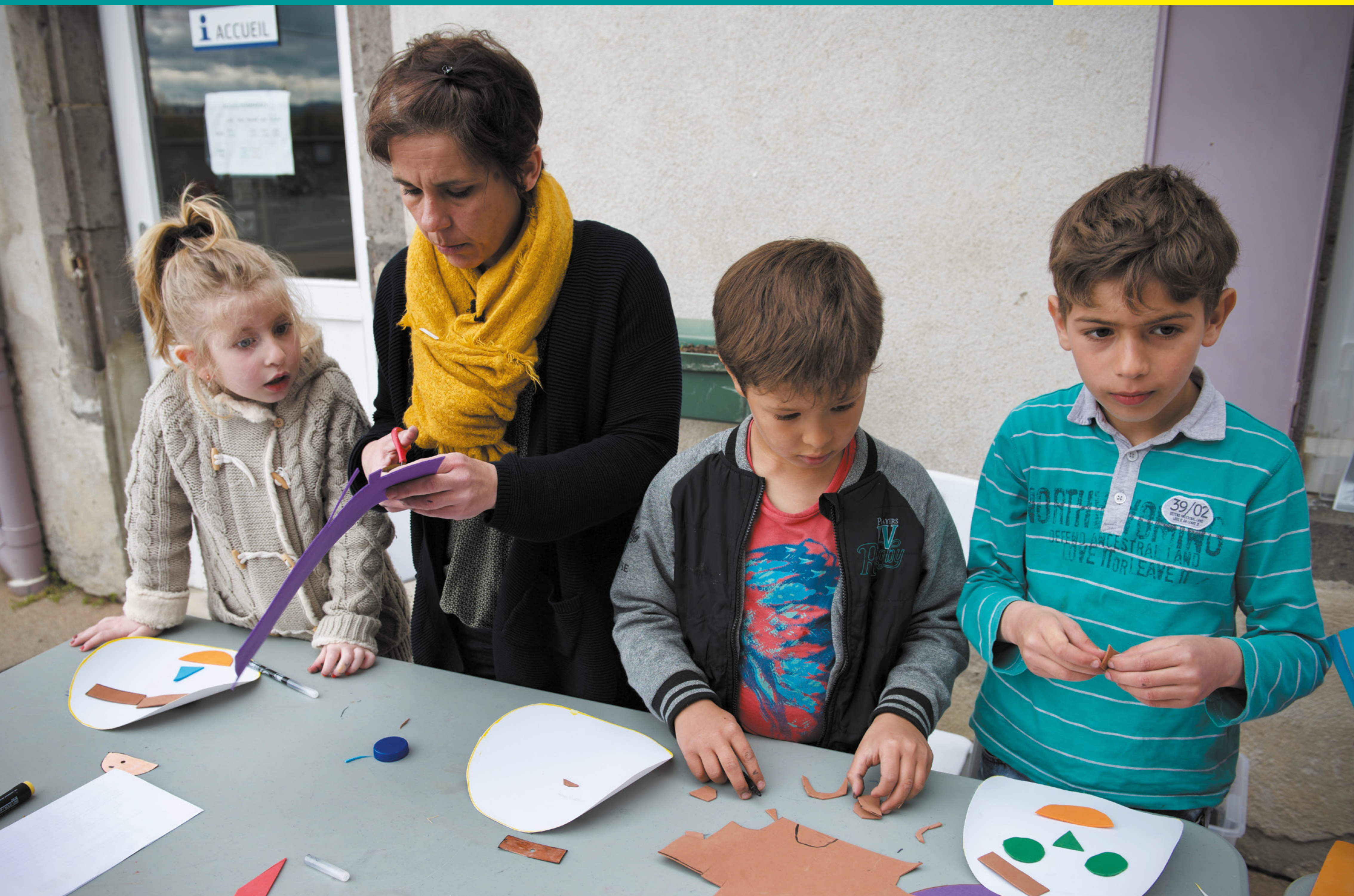
Ateliers avec les enfants réfugiés en Auvergne