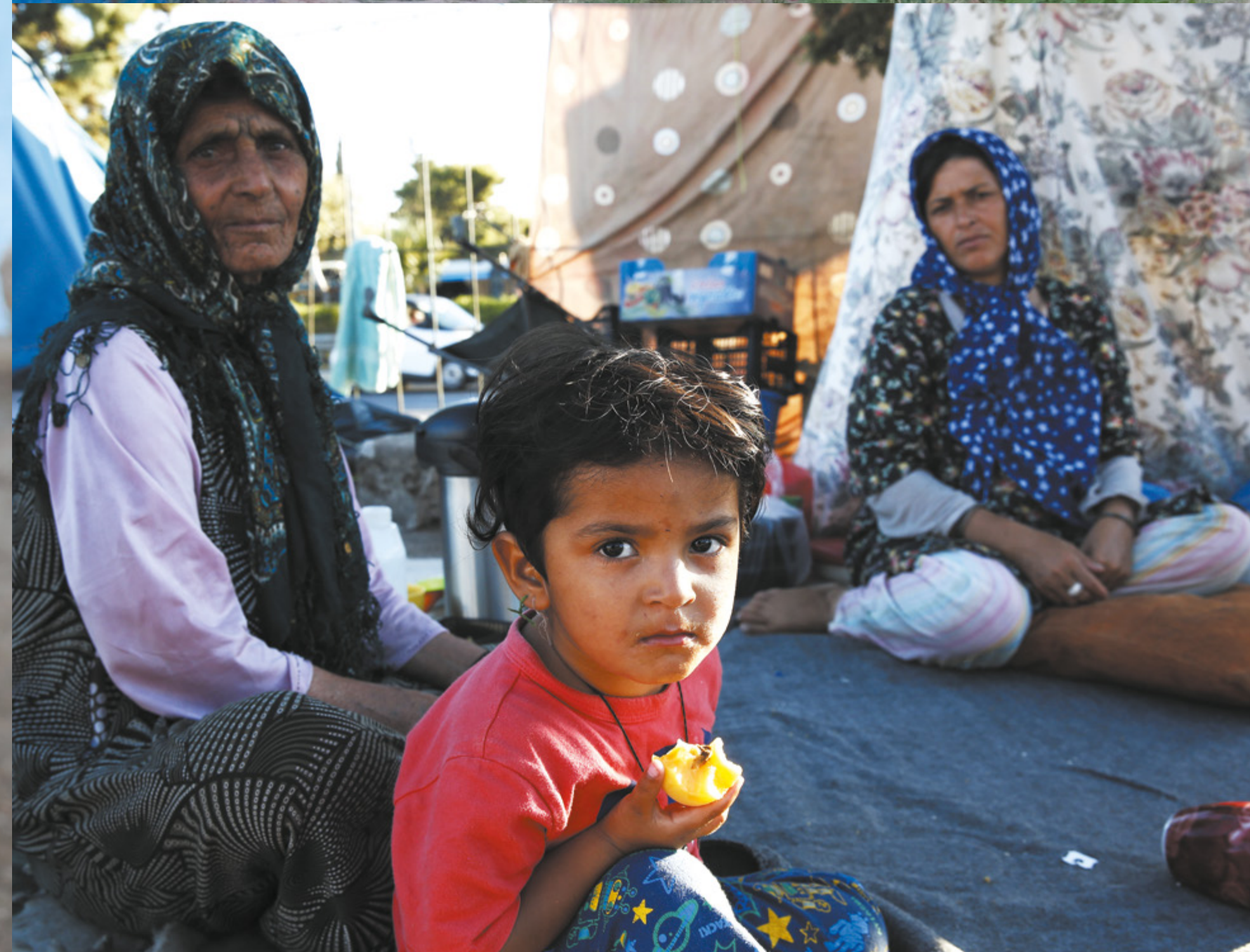
(À gauche) Réfugiés sur l'île de Chios © Giorgos Moutafis/AI - (En haut à droite) Réfugiés à la frontière entre la Syrie et la Hongrie © AI (En bas à droite) Réfugiés en Grèce, juillet 2016 © Giorgos Moutafis/AI