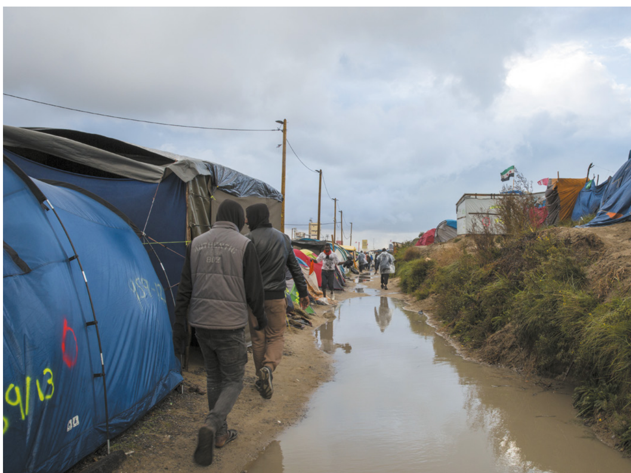
La "Jungle" de Calais

La France, 6 e puissance économique mondiale, a les moyens d'assumer ses obligations vis-à-vis des demandeurs d'asile. L'accueil des réfugiés se prévoit et s'anticipe. Il est ici question de volonté politique, qui manque fondamentalement aujourd'hui.