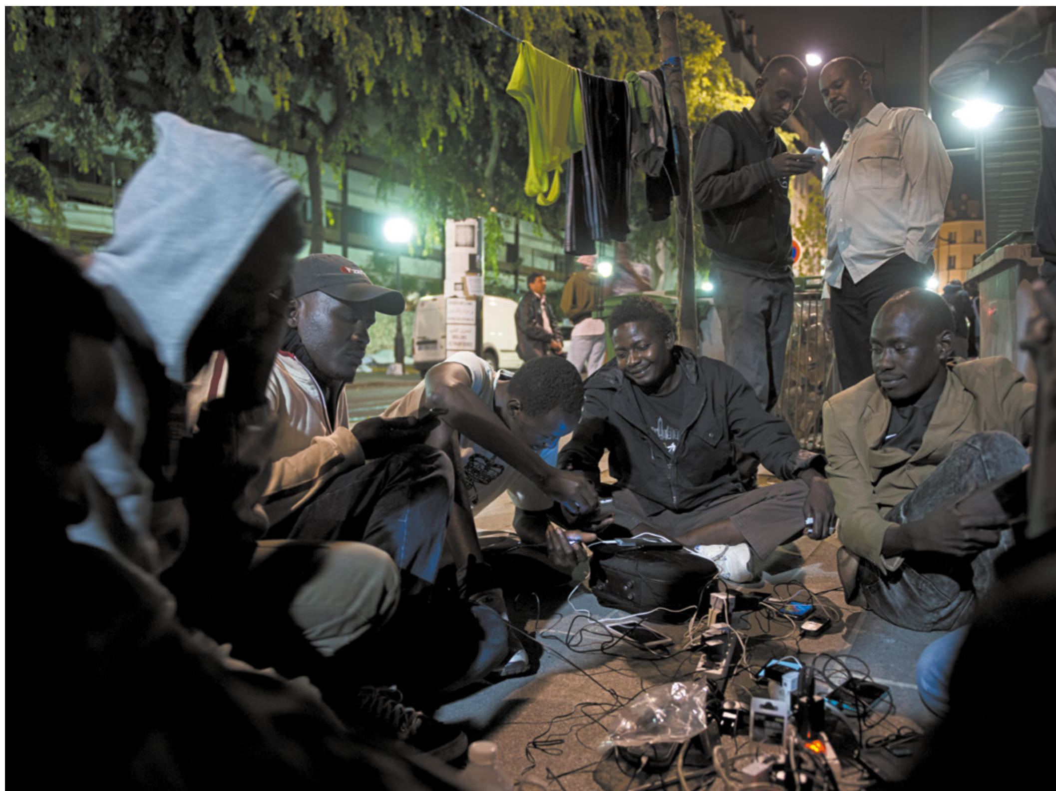
Paris, campement de La Chapelle, juillet 2015

Environ 700 000 personnes ont fait cette demande en Allemagne. Au total 273 000 réfugiés vivent en France alors que le Liban accueille 1,5 million de réfugiés.