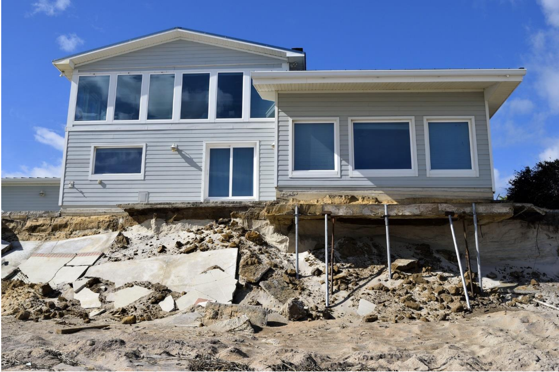
Réf. SF 20 EDH 02