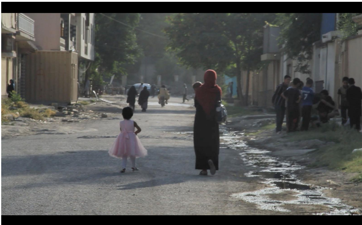
A Thousand Girls Like Me

C'est une honte ! J'ai l'impression que nous sommes en recul sur ce qui touche à la compréhension de la condition des femmes, alors qu'il y a encore tant de progrès à faire.